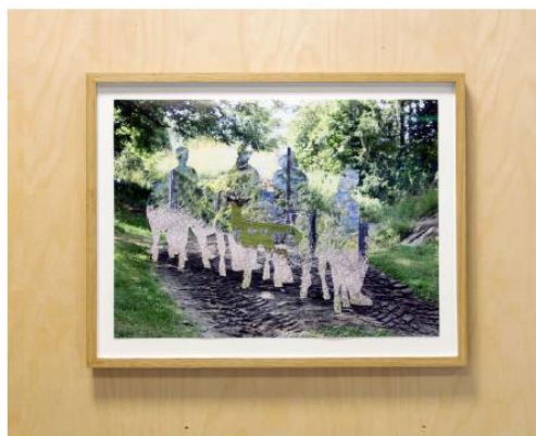
«Landskap i barn og dyr», Collage Ytterøy, Randi Nygård 2022

Kunsten er nå på plass på Ytterøy skole, samfunnshus og barnehage. Kunstneren Randi Nygård har laget en serie collager der hun setter lokale bilder og kunnskap inn i ulike «verdensbilder», kjente og mindre kjente forestillinger om verden. Offisiell åpning og lansering av en bok om prosjektet er planlagt til våren.