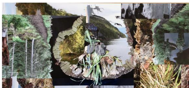
«Karbonkretslop» Collage Ytterøy, Randi Nygård 2022