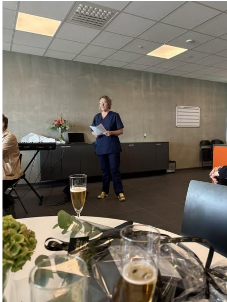
Åpning av Innherred Kvinneklipp