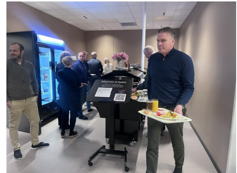
Næringslivstur til Ytre Namdal i februar