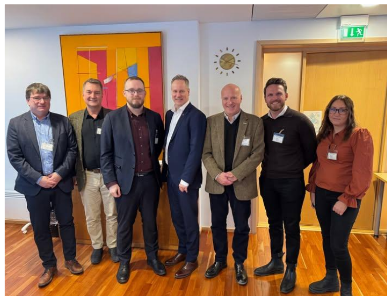
Møte med Samferdselsministeren