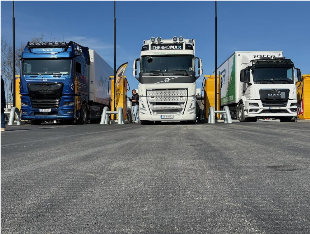
Bisto Leiv Sand med analyse/effektive koblinger med Tensio/NTE ifm forberedelser for Uno-X ladestasjon