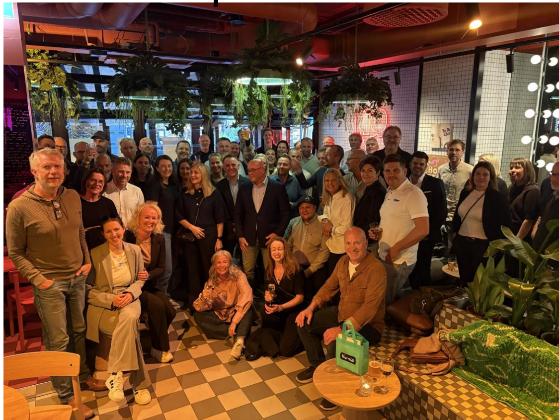
Næringslivstur til Finland