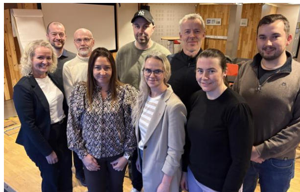
Beredskapsforum ble opprettet