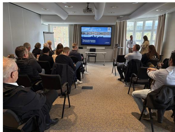
Næringslivstur Östersund kommune