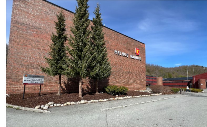
MILLIONSMEL: Melhus kommune styrer mot et stort underskudd, det viser en fersk rapport.