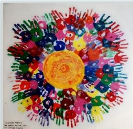
Bilde: "Levangers framtid". Fra barnas festival 2005.

Kommunen vår er trivelig, og vi føler oss trygge til alle tider på døgnet uansett hvor vi er. Veiene er opplyste. Vi har sykehus. Alle kjenner noen som man kan stole på. Samfunnet er sunt, og rus er ikke et problem.