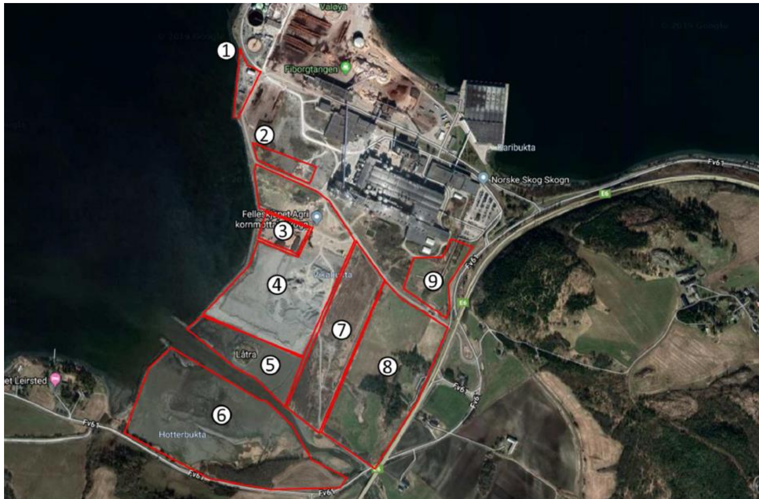
Nytt næringsareal Fiborgtangen, Skogn - Levanger formannskap 21.08.19 - Håkon Okkenhaug, næringssjef