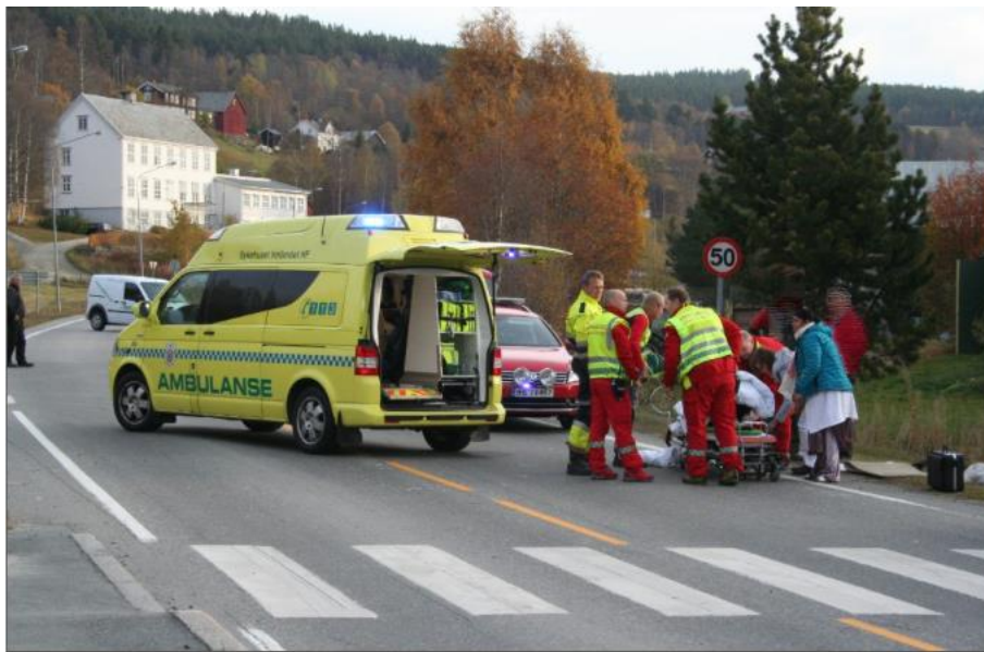
Ei skolejente på sykkel ble truffet av en bil i dette fotgjengerfelte på fylkesveg 30 på Tolga fredag morgen.