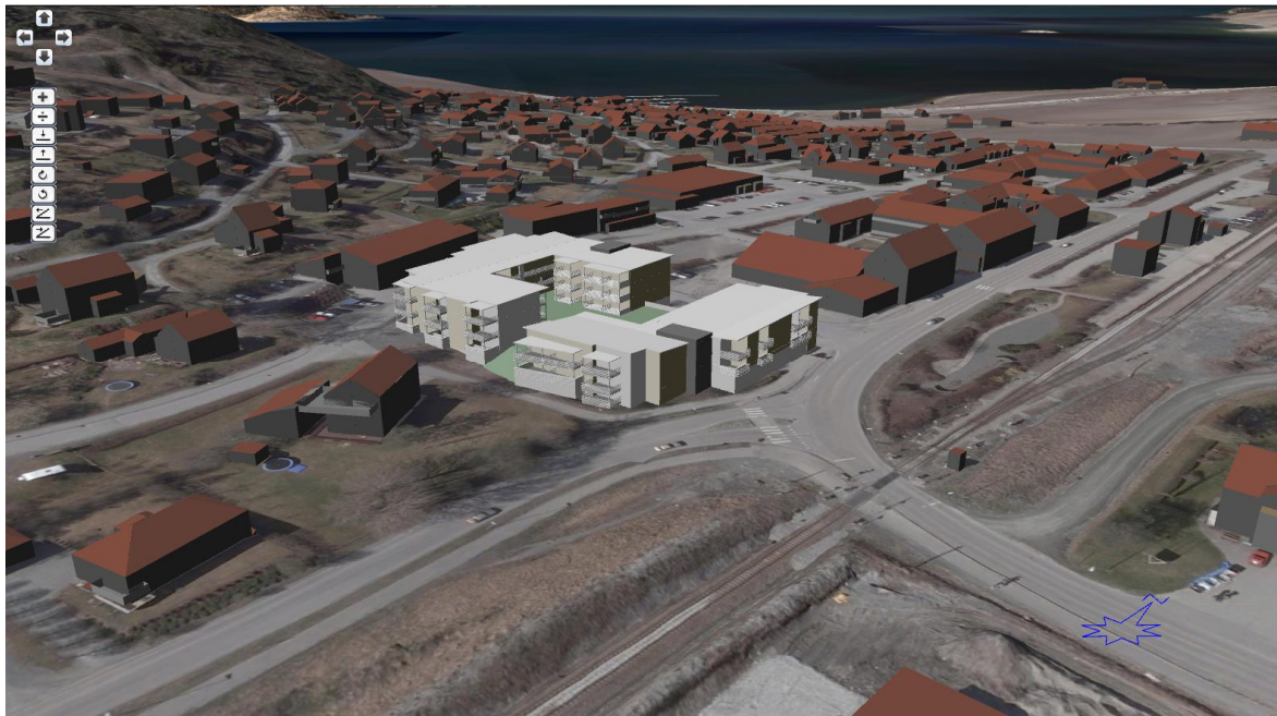
Planlagt bebyggelse i sentrum av bildet (med lys farge).

Illustrasjoner fra kart og plandata i 3D http://tema.webatlas.no/innherred/Web3D#