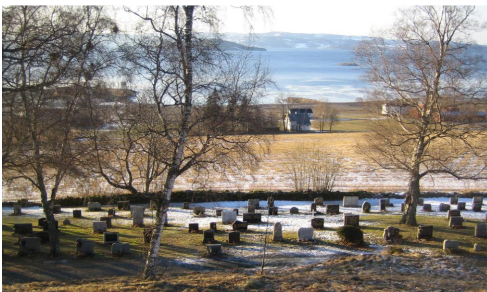
Bildet er tatt fra Olves/Alfhaugen og nedover mot vest. Arealet for utvidelse ligger nedenfor eksisterende kirkegårdsmur.

Eksisterende kirkegård ligger på laveste punkt på kote 52, og høgste punkt på kote 62. Over dette rager Olves-/Alfhaugen, som ligger fra kote 60-66, og er en av fylkets største gravhauger med en utstrekning på ca. 55m. Terrengformasjonen, kirkebygget, gravhaugene, kirkemuren, de mange gravminnene og de gamle asketrærne utgjør sammenlagt et sted med veldig spesiell karakter, med stor verdi for omgivelsene både i kraft av den funksjon, den historie og de estetiske, religiøse og kulturelle elementer det innehar.