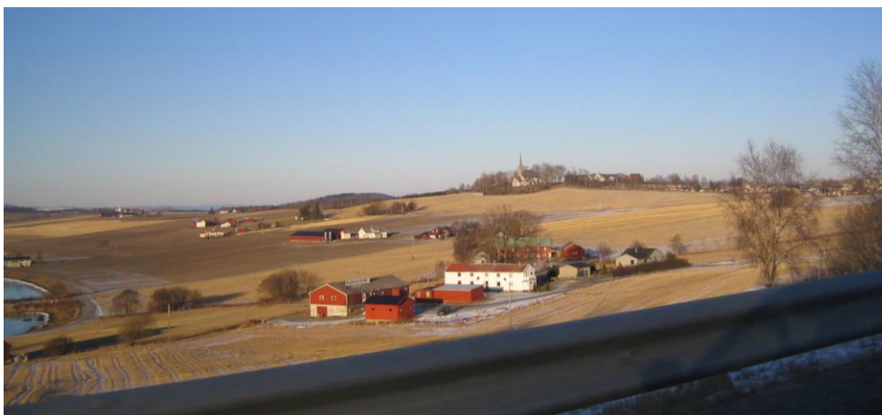
Bildet er tatt fra E6, sørvest for Alstadhaug kirke. Kirka og kirkegården ligger høyt, og heva over kulturlandskapet omkring. Kirkegårdsutvidelsen vil fra dette standpunktet så vidt kunne skimtes nedenfor eksisterende kirkegård.