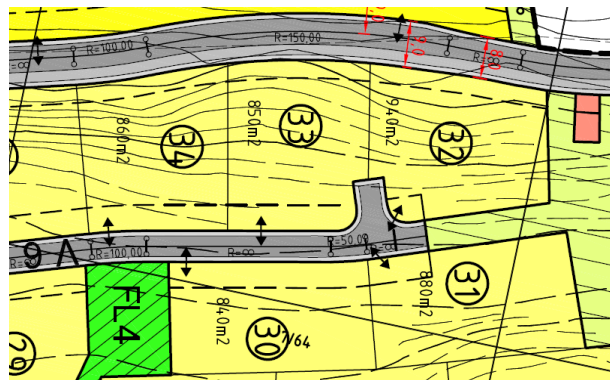
Utsnitt av endringsforslag rev. 28.05.10

Kartutsnittene ovenfor viser gjeldende plan til venstre og endringsforslaget til høyre.