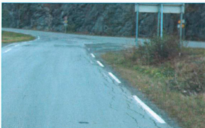
Fv. 104 x rv. 753

Atkomsten til anlegget finner sted fra rv. 753 via fylkesveg 104 sør for Hoplastunnelen. Skiltet hastighet på stedet er 60 km/t. Siktforholdene og geometrien i krysset med riksvegen er lite gunstige for store kjøretøy som kommer fra fylkesvegen og skal sørover i retning Åsenfjord. Vegnormalenes krav til sikt i er imidlertid oppfylt så lenge fartsnivået er i tråd med skiltet hastighet. For fylkesvegen sin del er atkomsten fra settefiskanlegget heller ikke geometrisk tilfredsstillende, og siktforholdene er begrensede - dels grunnet vegetasjon.