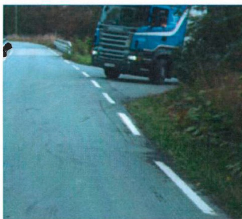
Atkomst til Åsen Settefisk fra fv. 104

Postadresse Statens vegvesen Region midt Fylkeshuset 6404 Molde